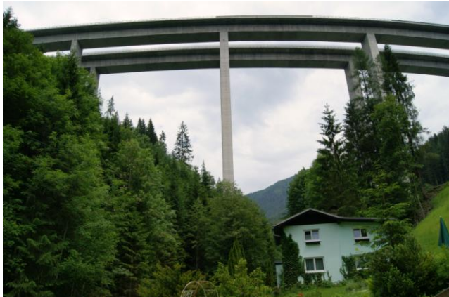
Hüttau – most Larzenbach na A10 (1979 r.)