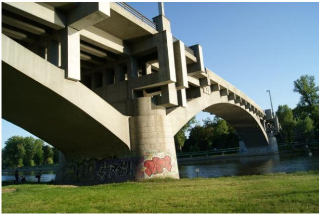
Most Masaryka w Kralupach n. Wełtawą