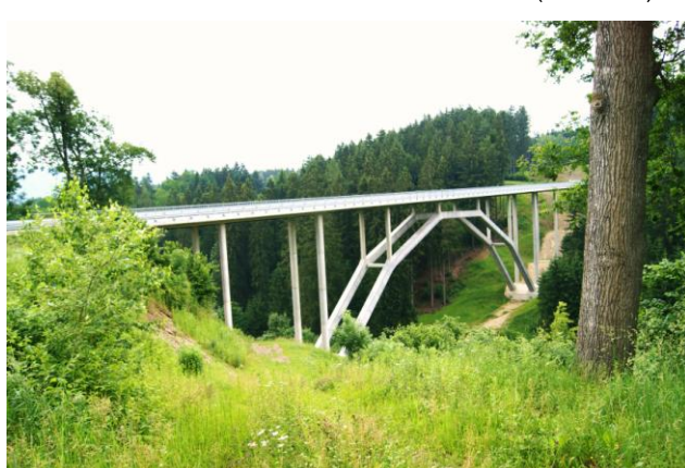
Völkermarkt – z elementów fibrobetonowych (2010 r.)