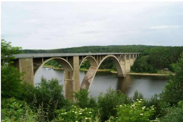
Żelbetowy w Podolsku n. Weltawą (1942 r.)