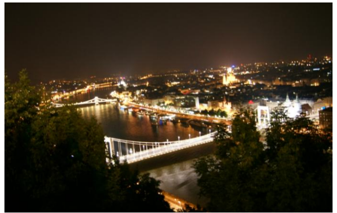
Mosty budapeszteńskie nocą