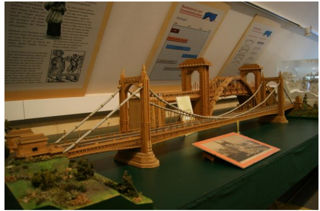
Muzeum w Edelsbach – jeden z modeli