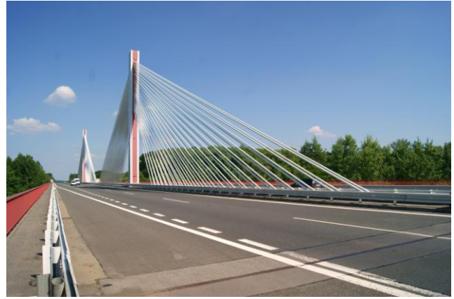
Most autostradowy – Podiebrady (1990 r.)