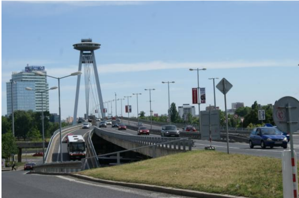
Nový most (d. SNP) w Bratysławie (1972 r.)