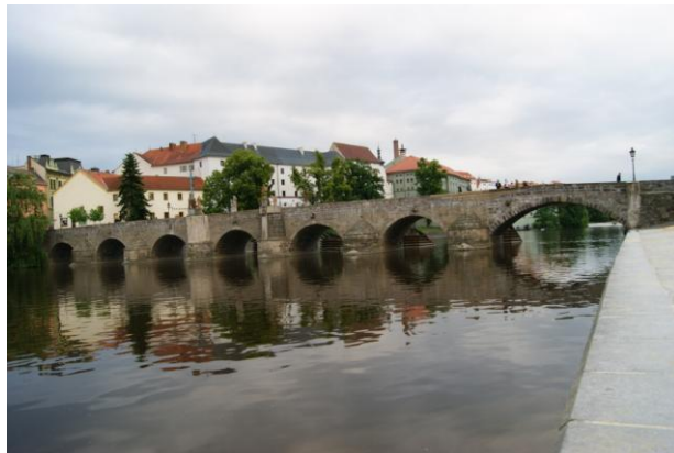
Pisek – najstarszy most gotycki (XIII w.)