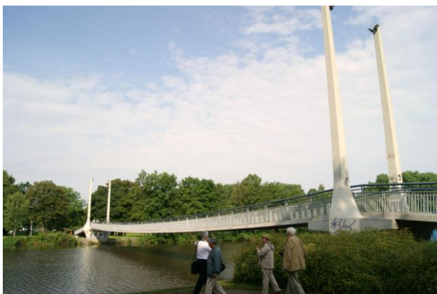
Czeskie Budziejowice – kładka wstęgowa (2002 r.)