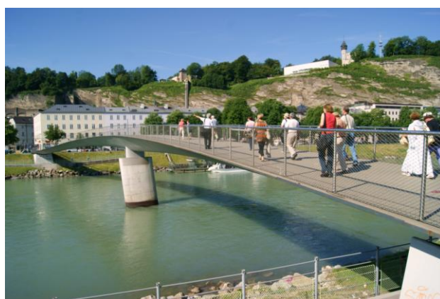
Salzburg – kładka Makarta (2001 r.)