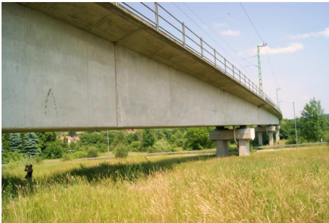
Wiadukt kolejowy w Nagyrákos (2001 r.)