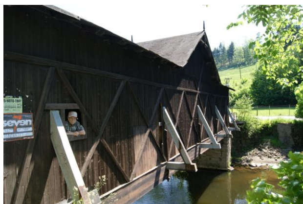
Bistra n.Izerą – drewniany zadaszony (1922 r.)