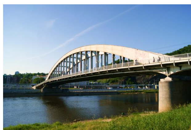
Most Beneša n.Łabą (największy w 1936 r.)