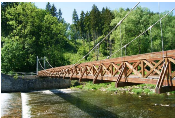
Kładka wisząca n.Izerą w Benešov (2002 r.)