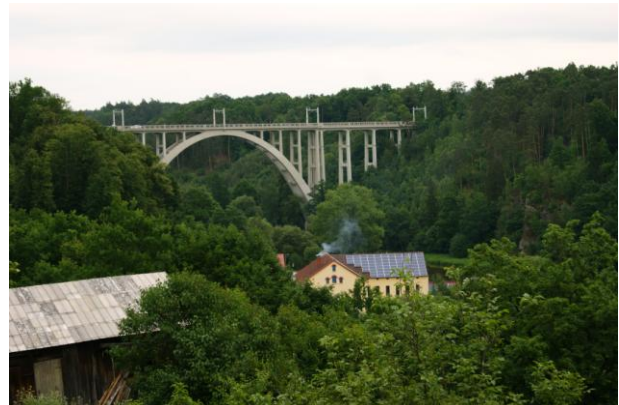
Bechyně – żelbetowy drogowo-kolejowy (1928 r.)