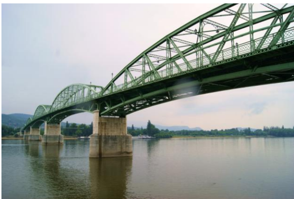
Esztergom - most konfliktu na Dunaju