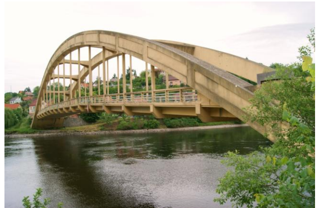
Most dr Beneša w Štěchovicach (1939 r.)