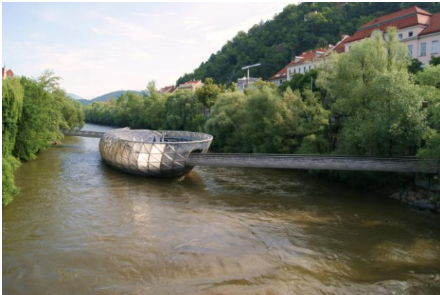
Atrakcja Grazu – sztuczna wyspa na rz. Mur