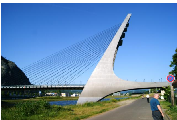
Most Mariański w Ústí n.Łabą (1998 r.)