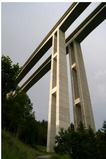
Most na A2 przez dolinę Lavant k. Wolfsbergu w Karyntii (1981 i 2007 r.)