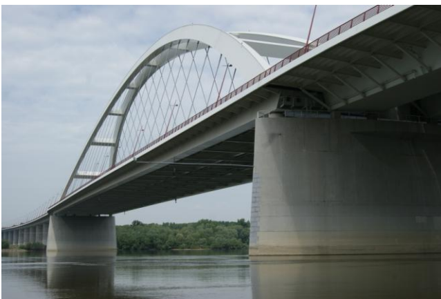
Most Pentele k. Dunaújváros (2007 r.)