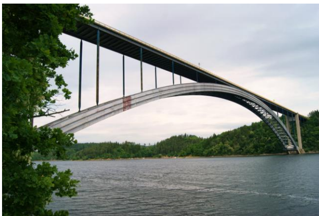
Most Žďakov k. Kotelnicy n. Wełtawą (1965 r.)