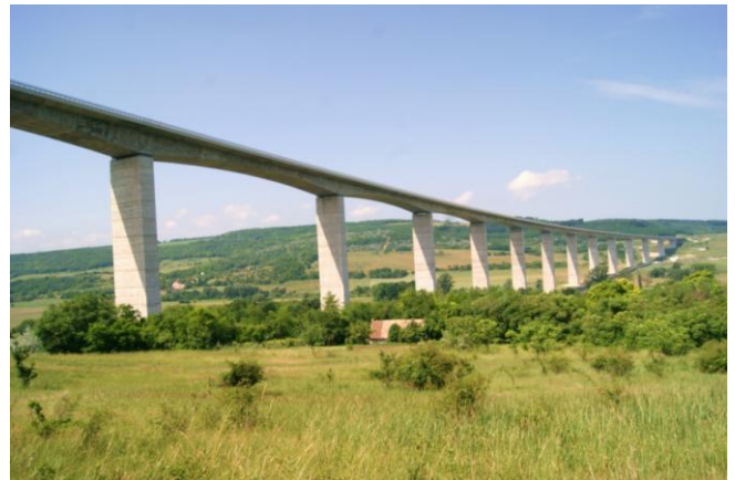
Wiadukt autostradowy Köröshegy (2006 r.)