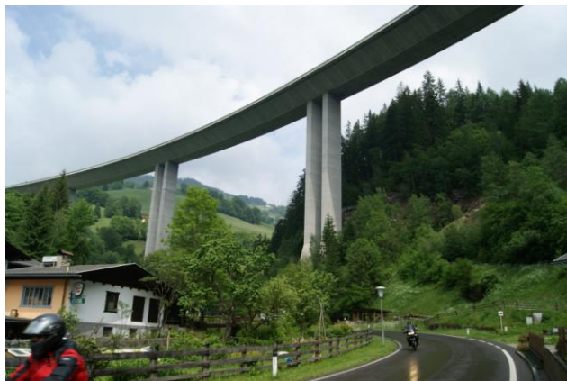
Kremsbrücke – most Krems na A10 (1980 r.)