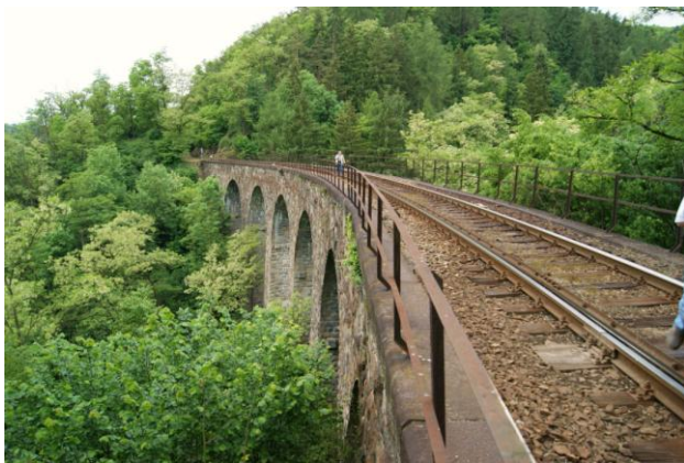
Žampach – najwyższy most kamienny (1899 r.)