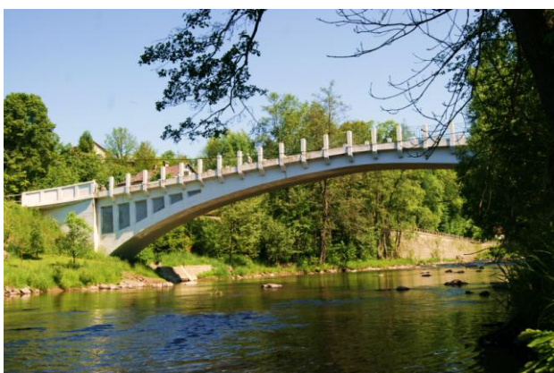
Dolní Svatá – najstarszy żelbetowy (1912 r.)

Dodatkową, nie mostową atrakcją Wyprawy były: zwiedzanie kopalni srebra i starej mennicy w Kutnej Horze, zamku Karola IV w Karlszteinie, zamku Rožmberków w Czeskim Krumlovie, pałacu Schönbrunn w Wiedniu, opactwa benedyktynów w Tihany, bazyliki w Esztergom oraz kąpiel w największym europejskim jeziorze termalnym w Hévíz. Były też dwa wieczory z degustacją win: słowackich w Sv.Jurze oraz austriackich na Grinzingu – zielonej dzielnicy Wiednia. Tam też podsumowaliśmy naszą Wyprawę, wręczając upominki zasłużonym organizatorom oraz zwycięzcy konkursu z wiedzy mostowej wśród nie-mostowców.