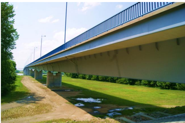
Most św. Ludwika na Dunaju k. Szekszárd (2002 r.)