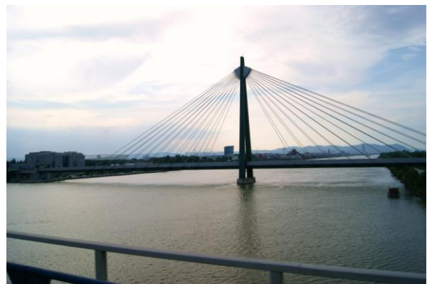
Wiedeń – podwieszony na linii metra (1997 r.)