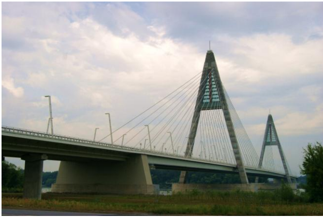
Most Megyeri k. Budapesztu na Dunaju (2008 r.)