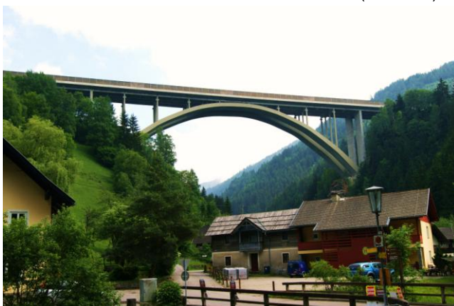
Most na A10 w Karyntii