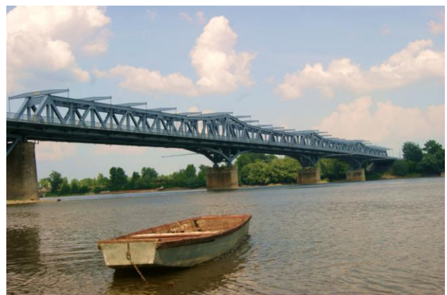
Most kolejowo-drogowy w Baja na Dunaju (1909 r.)