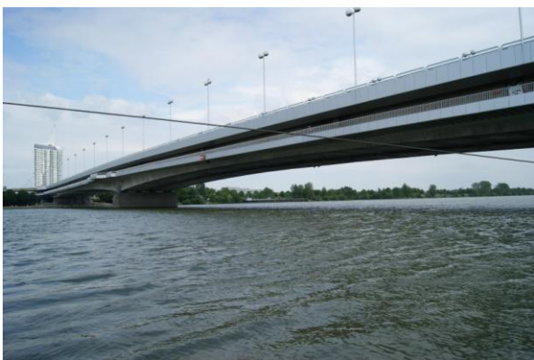
Wiedeń – trzeci Reichsbrücke z 1980 r.