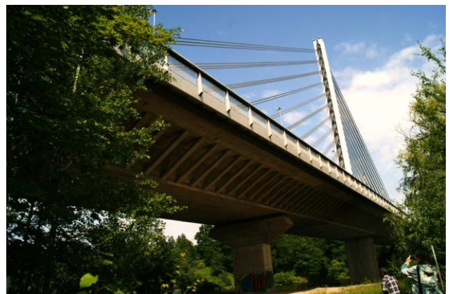
Most przez jez. Jordan k. Taboru (1990 r.)