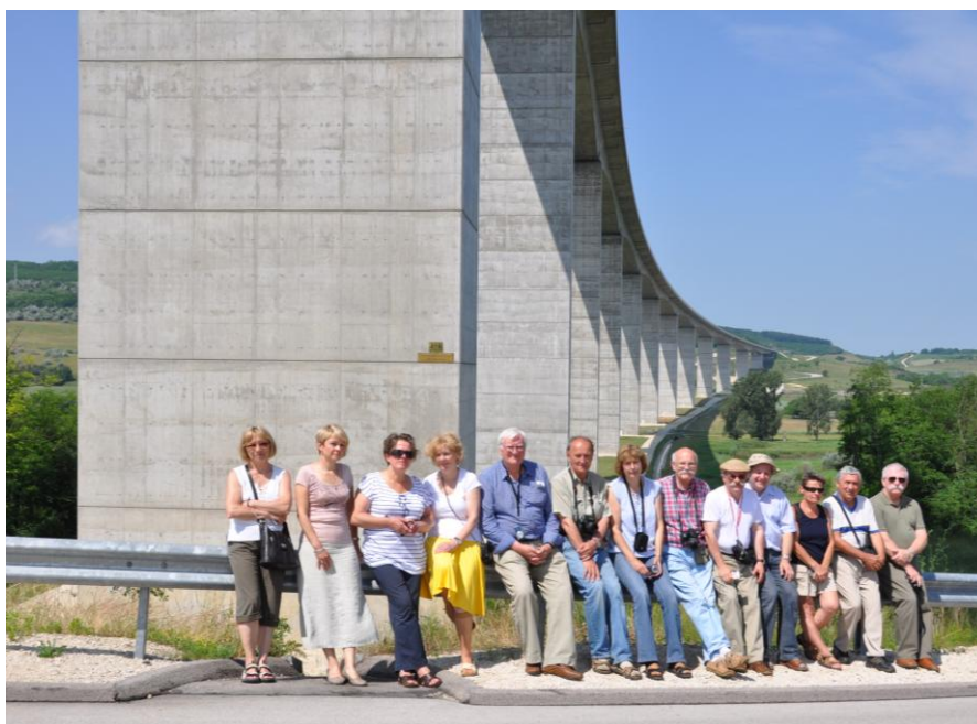
Grupa Wyprawowiczów w komplecie na tle wiaduktu Köröshegy (Węgry)