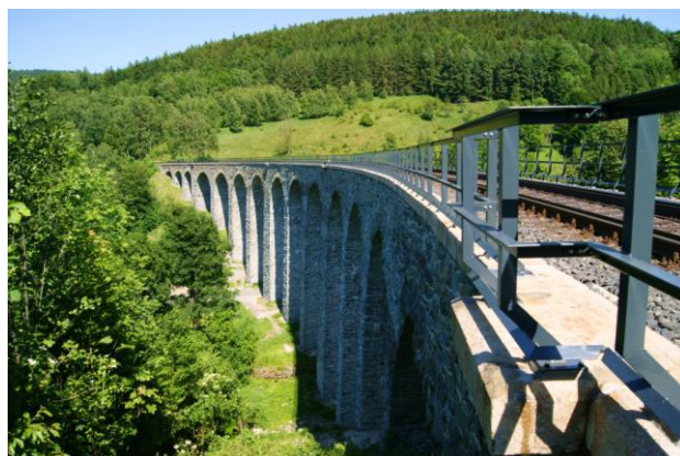
Wiadukt Novina k.Křištofovo Udolí (1900 r.)