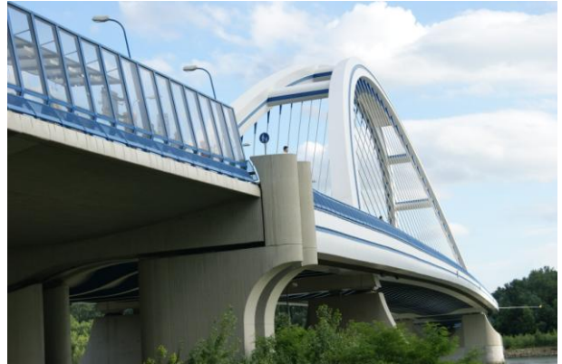
Most Apollo w Bratysławie (2005 r.)