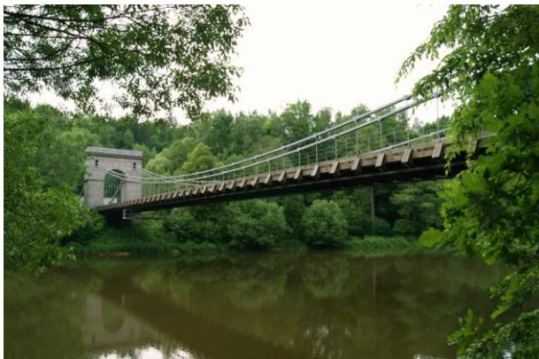
Stádlec – wiszący (przeniesiony z 1848 r.)