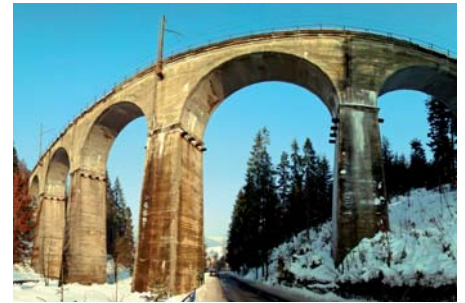
Piotr Rychlewski Most kolejowy przez potok Łabajów w Wiśle (2)