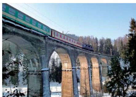
Piotr Rychlewski Most kolejowy przez potok Łabajów w Wiśle