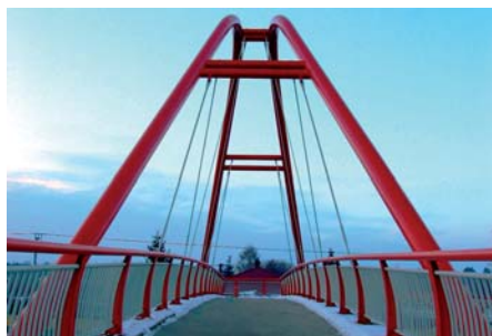
Czesław Prędota Jadwisin – kładka nad DK61 (3/4)