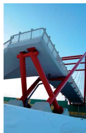
Czesław Prędotą Jadwisin – kładka nad DK61 (1/4)