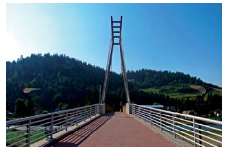
Piotr Rychlewski Kładka przez Dunajec w Sromowcach Niżnych (1)