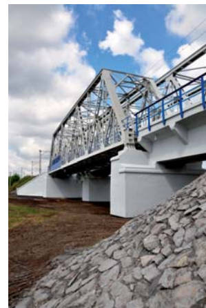
Mariusz Prędota Wiadukt kolejowy na linii Warszawa – Terespol (8)

Redakcja „Biuletynu Informacyjnego Związku Mostowców Rzeczypospolitej Polskiej” 03-301 Warszawa, ul. Jagiellońska 80, tel. 022 675 43 75, fax 022 811 17 92 e-mail: biuletyn@zmrp.pl , www.zmrp.pl